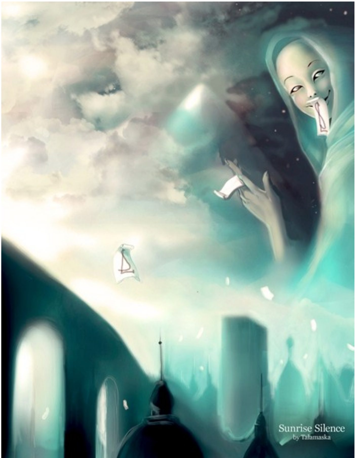
Sunrise Silence by Talamaska