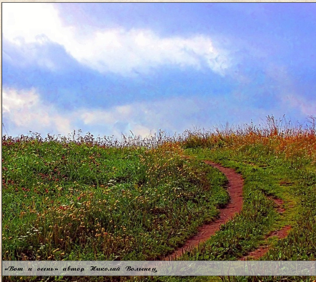
«Вот и осень» автор Николай Вольнец