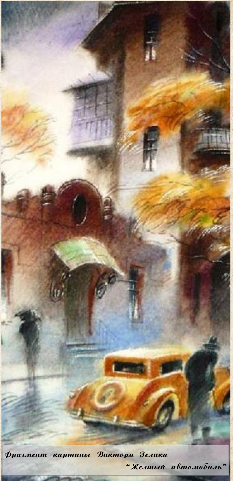
Фрагмент картины Виктора Зелика